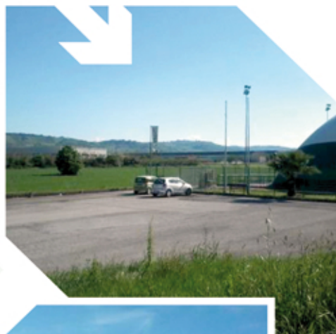
CENTOBUCHI PIASTRA POLIVALENTE

Nel territorio comunale sono state individuate 5 aree: