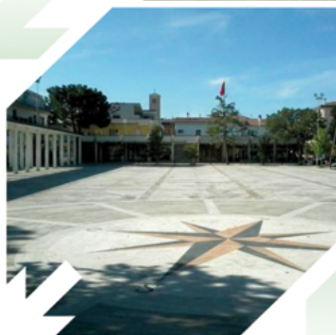
CENTOBUCHI PIAZZA DELL'UNITÀ